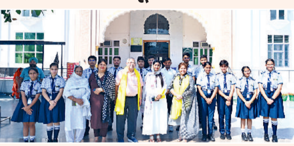
सोनीपत। गुरुद्वारे में राहत सामग्री लेकर पहुंचे स्कूल के विद्यार्थी एवं अन्य।

सोनीपत। ब्राइट स्कॉलर सीनियर सेकेडरी स्कूल ने पंजाब के बाढ़ प्रभावित परिवारों की सहायता के लिए एक दान अभियान का सफलतापूर्वक आयोजन किया। हमारे छात्रों, शिक्षकों, कर्मचारियों, प्रधानाचार्य और प्रबंधन की पूर्ण भागीदारी से, स्कूल समुदाय जरूरतमंदों के लिए आवश्यक राहत सामग्री एकत्र करने के लिए एकजुट हुआ। एकत्रित सभी सामग्री सेक्टर-15 गुरुद्वारा साहिब को सौंपी गई, जो पंजाब के प्रभावित क्षेत्रों में राहत सामग्री भेजने में सक्रिय रूप से शामिल है।