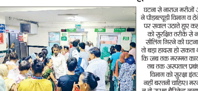
शिफ्ट करने के बाद ओपीडी के बाहर लगी भीड़।

घटना से नाराज मरीजों और उनके परिजनों ने पीडब्ल्यूडी विभाग व ठेकेदार की कार्यशैली पर सवाल उठाते हुए कहा कि मरम्मत कार्य को सुरक्षित तरीके से नहीं किया गया। यदि सीलिंग गिरने की घटना थोड़ी देर बाद होती तो बड़ा हादसा हो सकता था। उन्होंने मांग की कि जब तक मरम्मत कार्य पूरा नहीं हो जाता, तब तक अस्पताल प्रबंधन और पीडब्ल्यूडी विभाग को सुरक्षा इंतजामों में कोई टिकाई नहीं बरतनी चाहिए। मरम्मत कार्य के दौरान न तो सुरक्षा बैरिकेड लगाए गए हैं और न ही हरी पट्टी लगाकर क्षेत्र को बंद किया गया है।