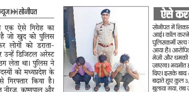
तकनीकी जांच के आधार पर तीनों आरोपितों को मध्यप्रदेश के शिवपुरी से दबोच लिया। आरोपितों से गहन पूछताछ के बाद उन्हें न्यायालय में पेश किया गया, जहां से उन्हें जेल भेज दिया गया।