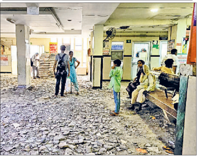
सोनीपत। उखाड़ा गया जिला नागरिक अस्पताल का ओपीडी परिसर।

मरम्मत कार्य के दौरान न तो सुरक्षा बैरिकेड लगाए गए हैं और न ही हरी पट्टी लगाकर क्षेत्र को बंद किया गया है।