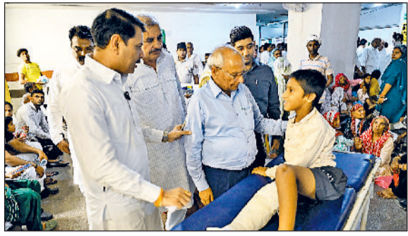
गोहाणा। अस्पताल में मरीजों का हालचाल जानते हुए समिति के सदस्य।