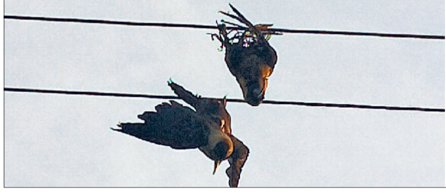
गोहाना। बिजली के तारों पर लटक रहे मृत कौवे व जमीन पर मृत पड़ा एक पक्षी व खंभे पर टेढ़ा लगाया गया इन्सुलेटर।

क्षेत्र के गांव धनाना में पुराने हथवाला मार्ग के साथ खंभे गाडकर बिजली की लाइन गुजारी गई है। इस लाइन पर गांव से करीब 600 मीटर की दूरी पर गणेश खाद एवं बीज भंडार के पास खंभे पर बिजली का करंट लगने से रोजाना पक्षी मौत का निवाला बन रहे हैं। गुरुवार को भी खंभे के पास तीन