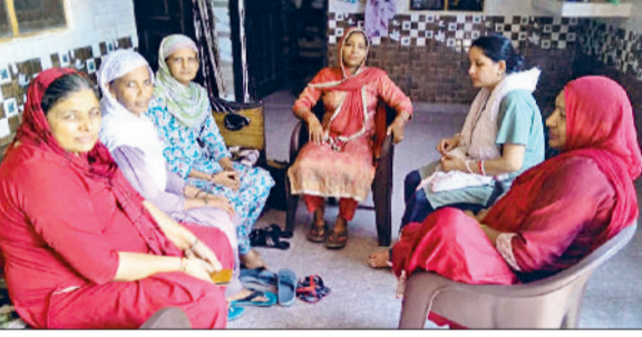
सोनीपत। अभियान के तहत लोगों को जागरूक करती आशा वर्कर्स।